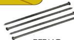
PERNO ESTACA ASFALTO