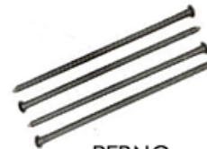
PERNO ESTACA ASFALTO