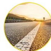
USO SOBRE ASFALTO