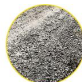
USO SOBRE GRAVA