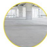
USO SOBRE CONCRETO